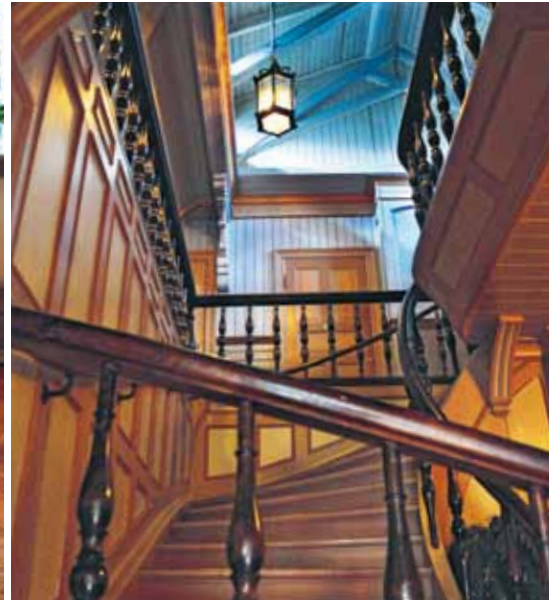
Den vackra trappan leder till andra våning där de flesta av pensionatets gästrum ligger. Trots att huset byggdes som privatvilla gick det lätt att anpassa planlösningen till den nya funktionen.

»Att ersätta de gamla fönstren har aldrig kommit på fråga. Det finns heller ingen anledning eftersom de håller värmen. Med innanfönster, cellulosafiber, bergvärme och stöddelning i kakelugnarna blir uppvärmningskostnaden för hela huset låg.«