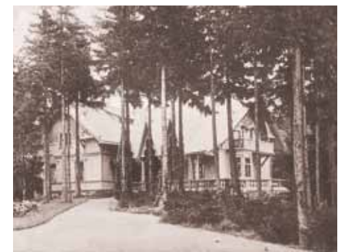
Vykortet visar Haegers villa 1906, när det var helt nybyggt.

Ståndsmässigt sommarviste Carl Emil Haeger ritade själv familjens hus som fick ett tidstypiskt formspråk med inslag av fornordiska drakhuvuden och schweizerstil. Hela byggnaden tillverkades vid en snickerifabrik i Lilla Edet, märktes upp och fraktades nerför