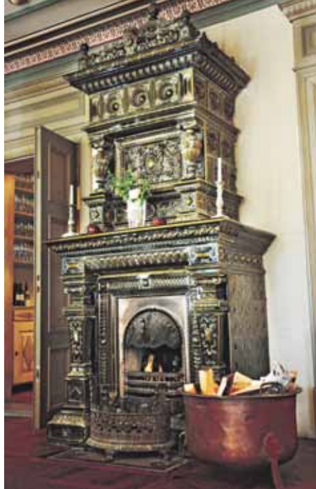
Den praktfulla kakelugnen i matsalen tros vara tillverkade i Gustavsberg.